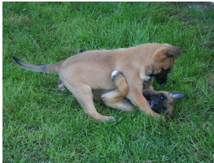
Cleia i underläge

2008-09-29 @ 11:28:32 Permalink Malco Kommentarer (2) Trackbacks ()